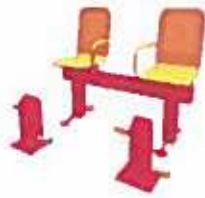
BANCO (XB-X04) ✓