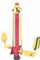
BALANÇA (ST-Z01X) ✓