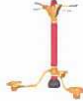
TWIST (ST-Z05X) ✓